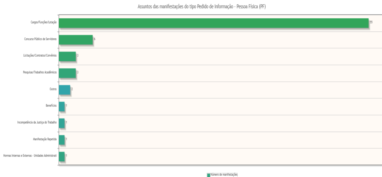
Gráfico 3 – Áreas mais demandadas – Tipo Pedido de Informação