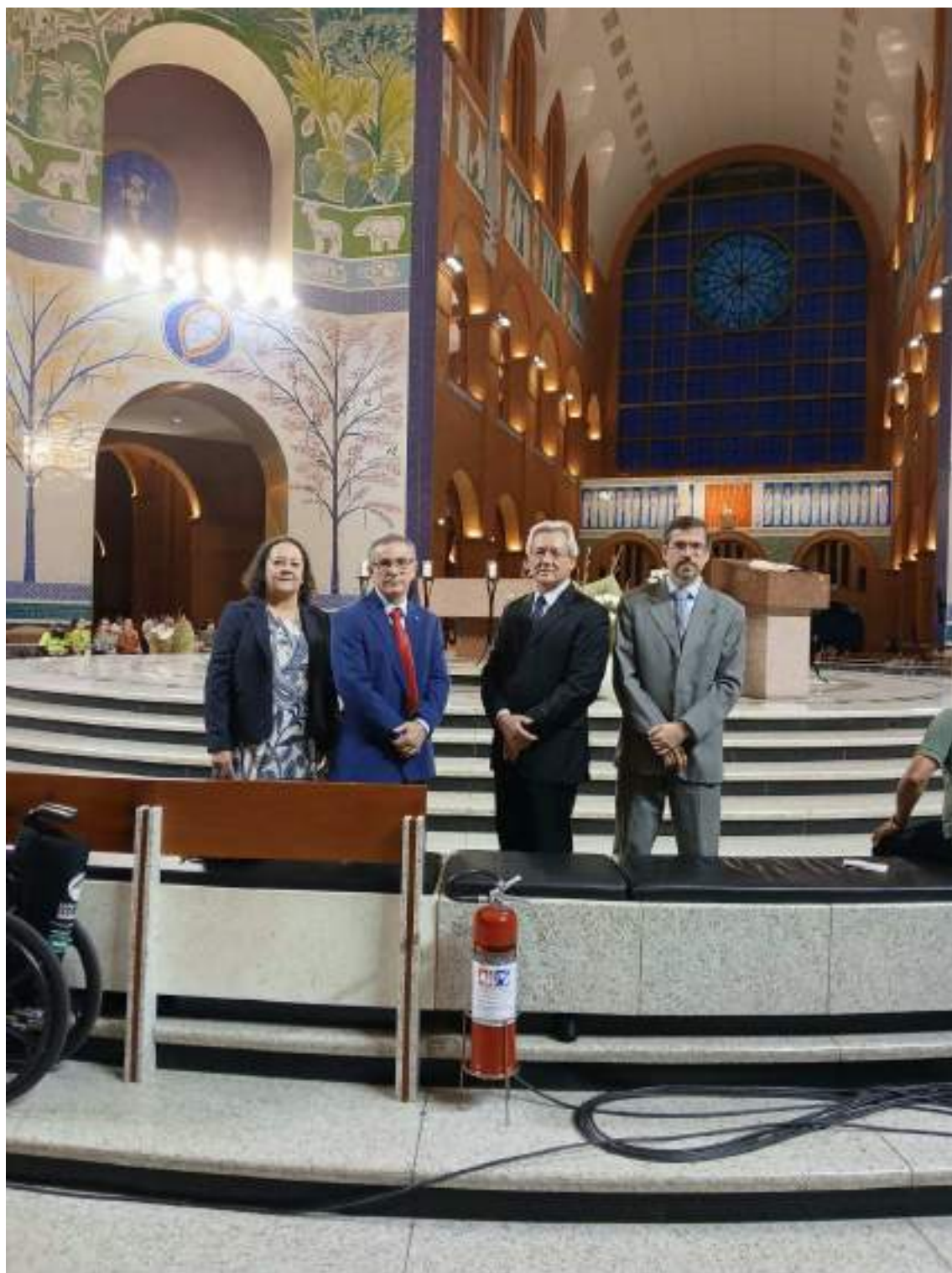
d. Participação no Programa “Mundo Jurídico” da Rede de Rádio CBN São José dos Campos para tratar de Combate ao Trabalho Infantil. Dia 07 de junho. Alcance Regional.