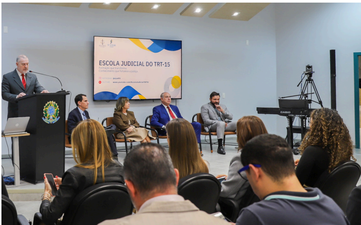
Evento: “Acessibilidade e Inclusão: Superando barreiras e abrindo espaço para a pluralidade”.