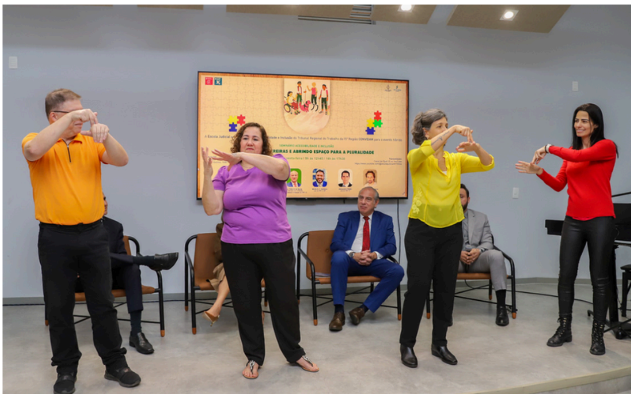
Coral de Libras do TRT-15 interpretando a canção “Aquarela”.