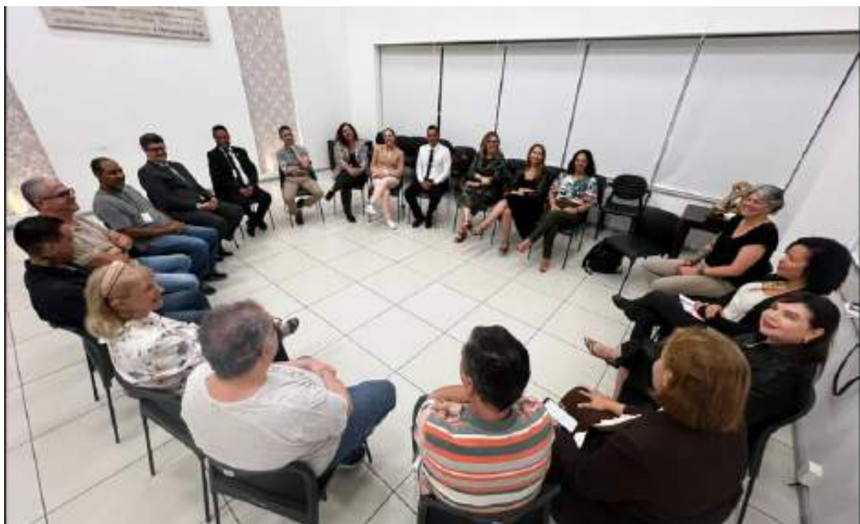
Participantes das Rodas de Conversa.