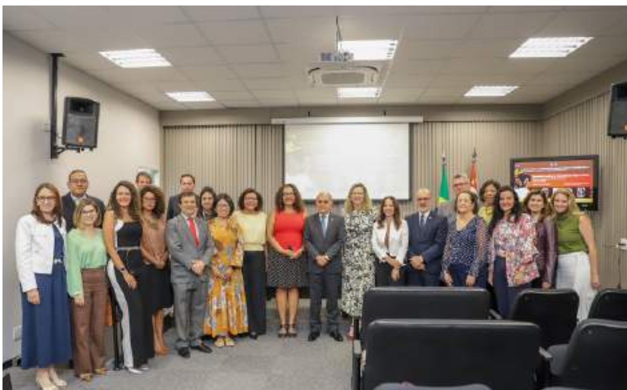
Participantes do seminário: "Consciência Negra Plena

".Link da notícia: https://trt15.jus.br/noticia/2025/consciencia-negra-plena-e-debatida-em-seminario-na-escola-judicial-do-trt-15 .