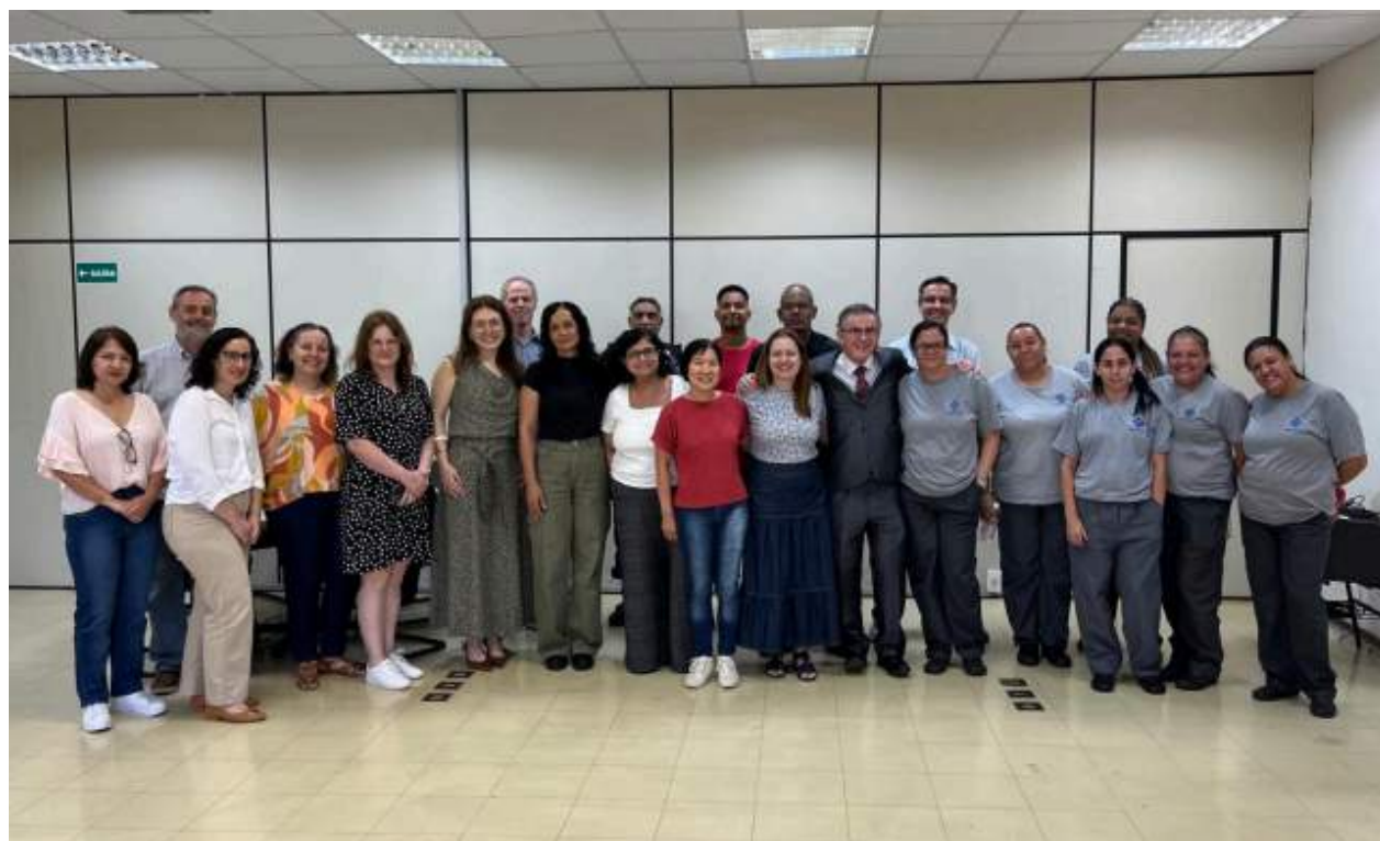
Participantes das Rodas de Conversa.