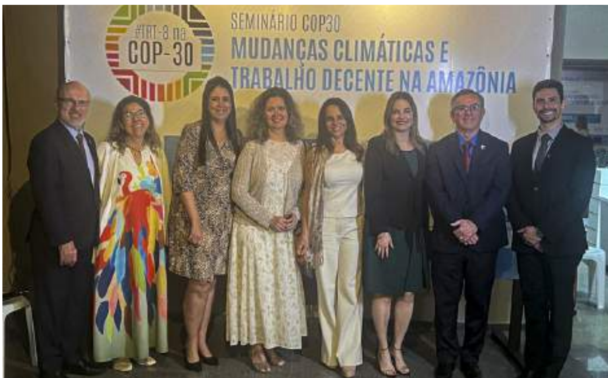
Participantes do Seminário: “COP-30: Mudanças Climáticas e Trabalho Decente na Amazônia”.

Link da notícia: https://trt15.jus.br/noticia/2025/coordenadores-de-comites-tematicos-do-trt-15-participam-em-belem-do-cop-30-mudancas .