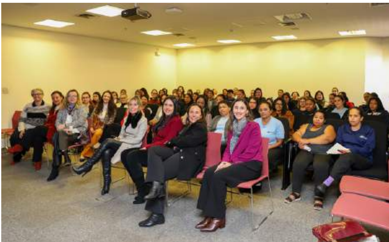
Participantes do evento: “Conversando sobre Violência Doméstica”.

Link da notícia: https://trt15.jus.br/noticia/2025/violencia-domestica-e-tema-de-encontro-de-mulheres-no-trt-15 .