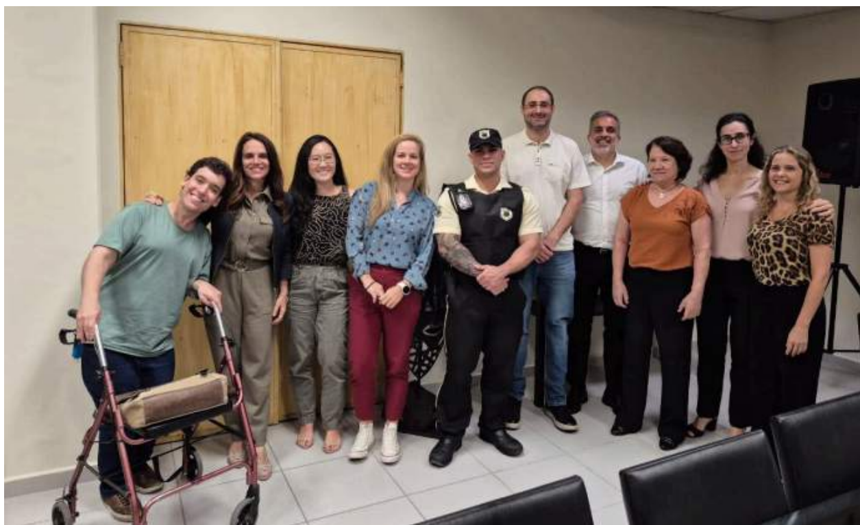
Participantes das Rodas de Conversa.